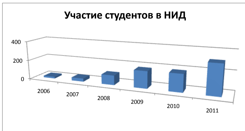
Рис.2 Участие студентов в НИД.

За отчетный период наблюдается тенденция возрастания интереса студентов к научно-исследовательской работе, что отражено в увеличивающемся количестве студентов, принимающих участие в научно-исследовательской деятельности (см. рис.2).